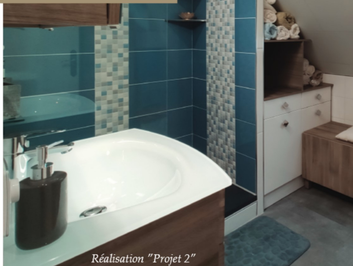
Réalisation "Projet 2"

Une déco d'intérieur pensée avec passion